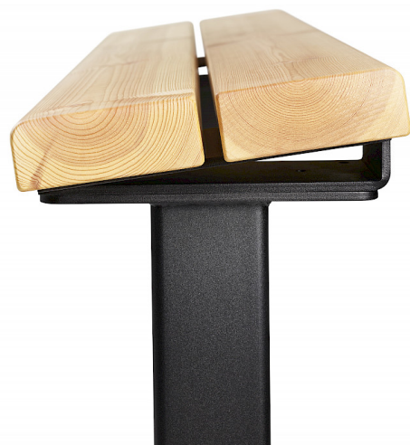
Lutningen på sitsen ger en mer behaglig sittställning.