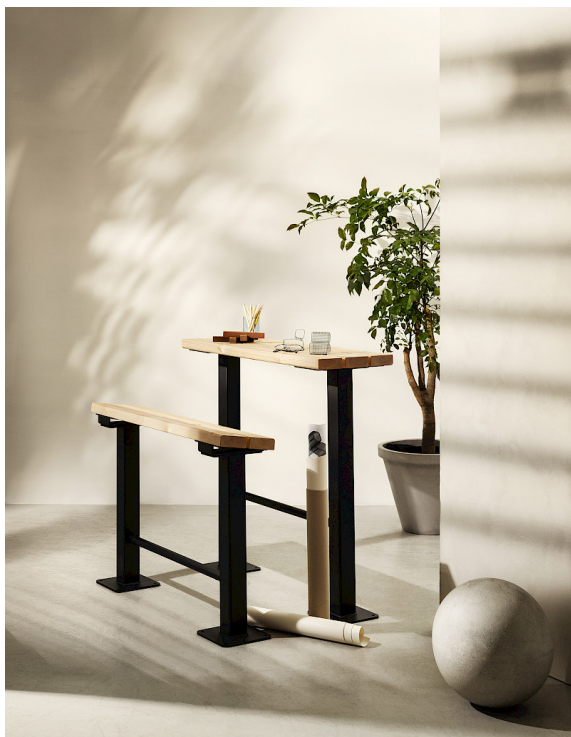
Tillsammans skapar Schoolyard bänk och bord en arbetsstation för utomhusklassrum.