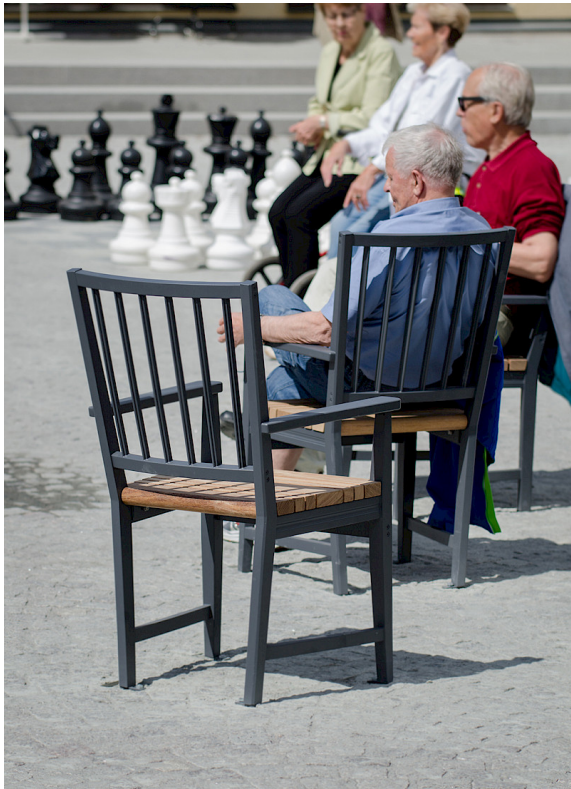
Med en lite högre sitt höjd (49 cm) är stolen tillgänglighetsanpassad. Armstöden är förlängda och greppvänliga.