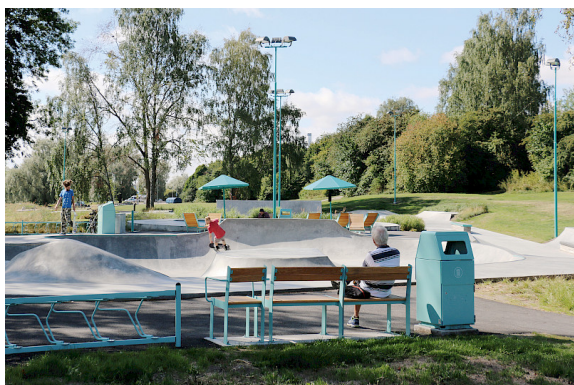
I Västerås skatepark sitter man bekvämt som åskådare i High Chair och High Sofa.