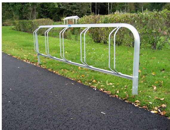
Ö03-13R, markfast cykelställ med rak inbörning