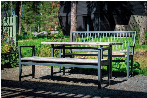
Leksand soffu, bord och bänk i Rosendals park, framtagen i samarbete med Temagruppen.