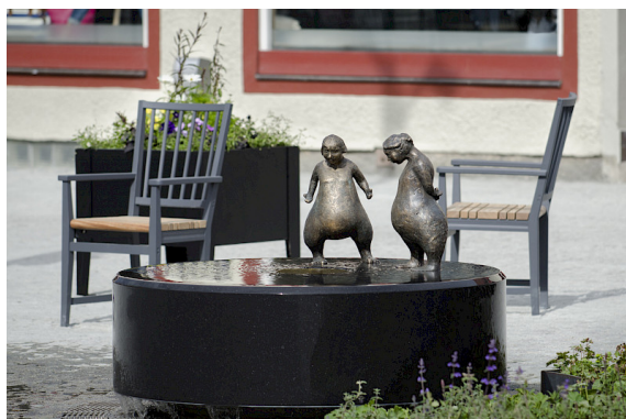
Inspirationen har hämtats från den klassiska trästolen som tillverkades i Leksand under tidigt 1800-tal. Bild: PE Teknik & Arkitektur