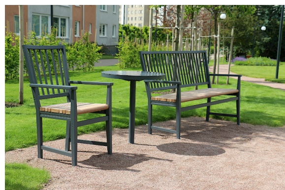
Leksand möbelgrupp i Åkerbyparken, Täby. Sittsar i obehandlad Cumaro är i stort sätt underhållsfria.