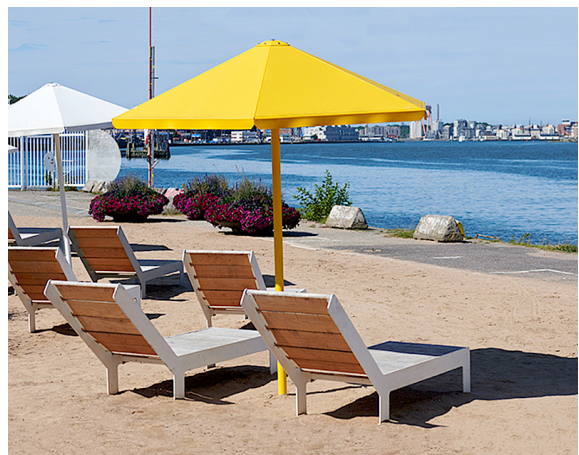
Der Stadtstrand Stenpiren in Göteborg. Hier sehen Sie die beiden Standardfarben gelb und weiß.