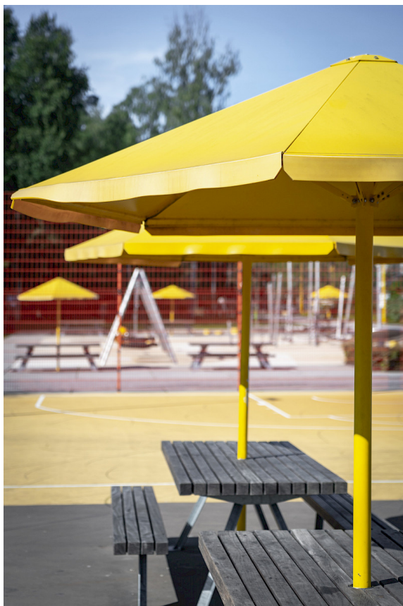
Four Seasons hat standardmäßig eine abgewinkelte Stange, kann aber auch mit einem geraden Pfosten bestellt werden. Hier in Rosendal, Uppsala.